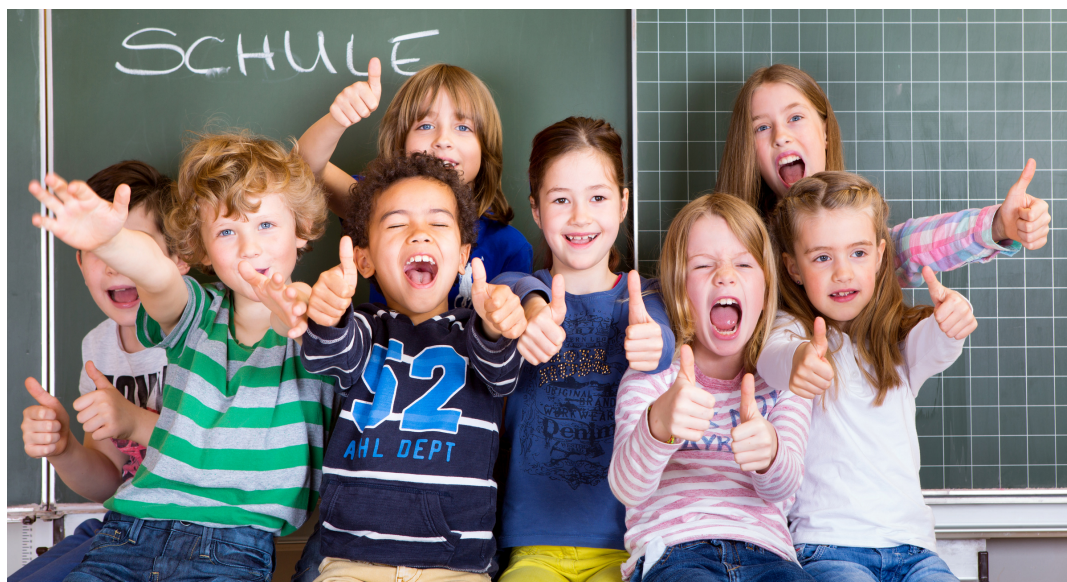
Für 884 Erstklässler hat am 3. August die Schule begonnen

Zwei erste Klassen besuchen die neue Grundschule im CAT an der Hamburger Allee. Sie ist aus der Umwandlung des Sprachheilpädagogischen Förderzentrums hervorgegangen. Die neue Grundschule im Stadtteil Mueßer Holz unterrichtet Kinder mit und ohne sonderpädagogischen Sprachförderbedarf.