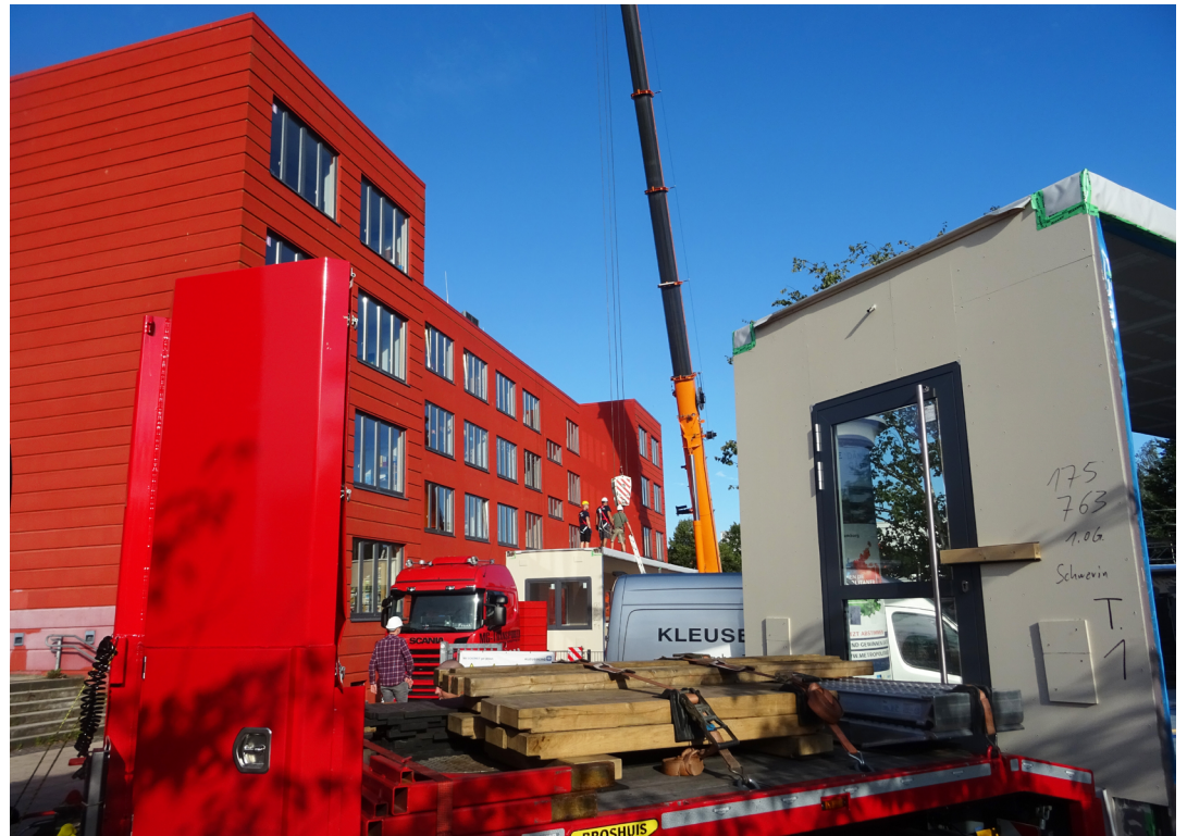
An der Astrid-Lindgren-Schule entstehen 88 zusätzliche Hortplätze.

Der Hort befindet sich in Trägerschaft des Internationalen Bundes. In der pädagogischen Arbeit verfolgt der IB-Hort den „Lebensbezogenen Ansatz“. Die Betreuung orientiert sich an den individuellen Situationen und Bedürfnissen, um die Kinder sowohl für das gegenwärtige als auch zukünftige Leben stark zu machen. Im Mittelpunkt stehen dabei Werte wie Gerechtigkeit, Friedensfähigkeit, Natur- und Umweltbewusstsein. Diese Werte werden durch das „Erleben“ als Methode und Prinzip gefestigt. Durch die 2018 erlangte Zertifizierung als „Haus der kleinen Forscher“