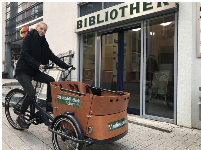
Der kostenlose Haustür-Service der Stadtbibliothek wurde für den Deutschen Lesepreis nominiert.

oder andere Medien aus und bestellt diese zu den Öffnungszeiten telefo-