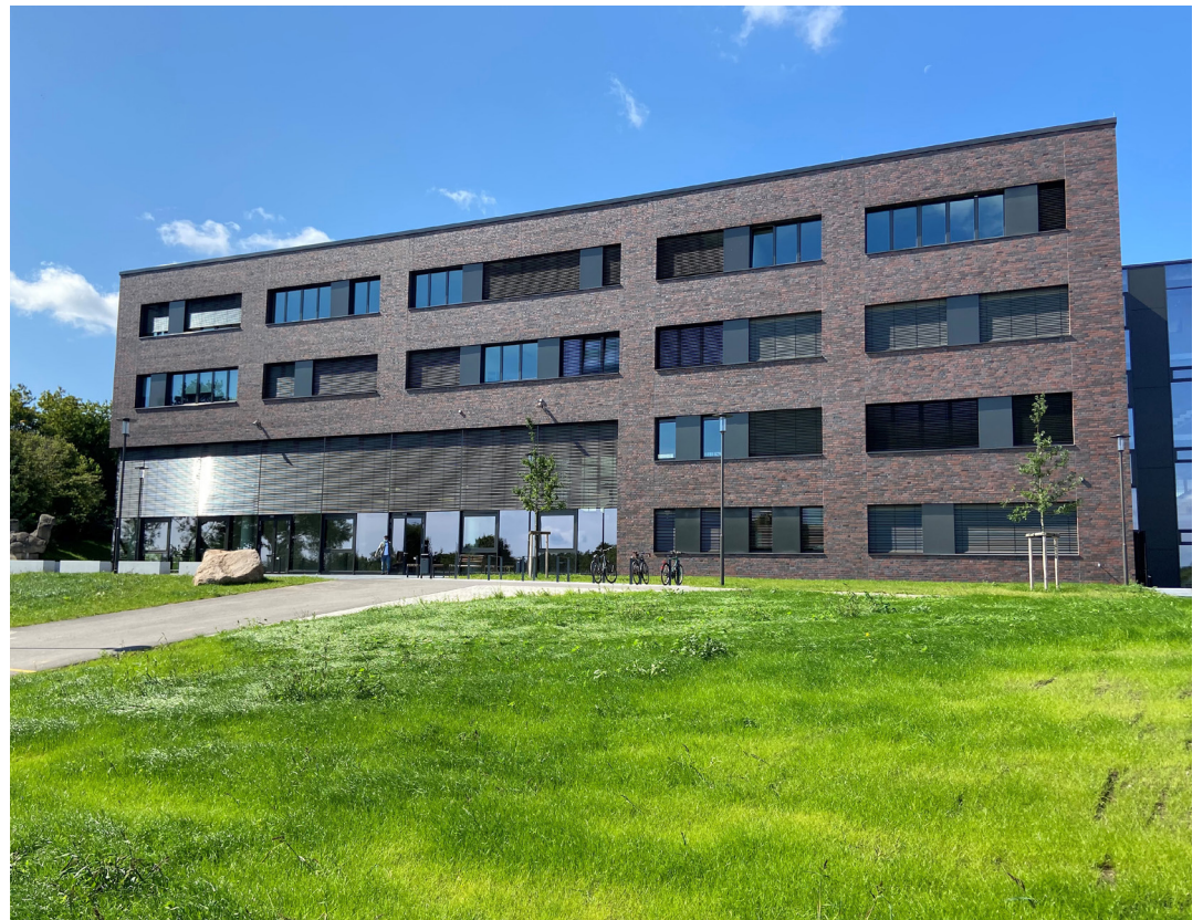
Nach knapp dreijähriger Bauzeit ist das größte Bauvorhaben der Landeshauptstadt - der Ersatzneubau des Regionalen Beruflichen Bildungszentrums der Landeshauptstadt Schwerin Technik im Stadtteil Lankow - abgeschlossen.

Die Berufliche Schule Technik ist die größte Berufsschule der Landeshauptstadt. Sie besteht seit 1970. Ausgebildet werden an der Schule mehr als 20 Berufe, darunter fachgymnasiale Bildungsgänge bis zu den Fachpraktikern. Unterrichtet werden an der Schule die Fachrichtungen: Elektro- und Informationstechnik, Bautechnik, Maschinenteknik, Energietechnik und Automatisierungstechnik. Neben der dualen Ausbildung und Vollzeitausbildung gibt es Klassen für die Berufsvorbereitung und Fachpraktiker in den Fachrichtungen Maurer, Maler, Hauswirtschaft und Holzbearbeitung. Der Neubau der Schule macht es möglich, die Berufsausbildung in Lankow zu zentralisieren. Der viergeschossige Massivbau mit einer Bruttogeschosfläche von ca. 12.000 m 2 verfügt über 44 Unterrichtsräume – dazu zählen Klassenräume, Lernumgebungen