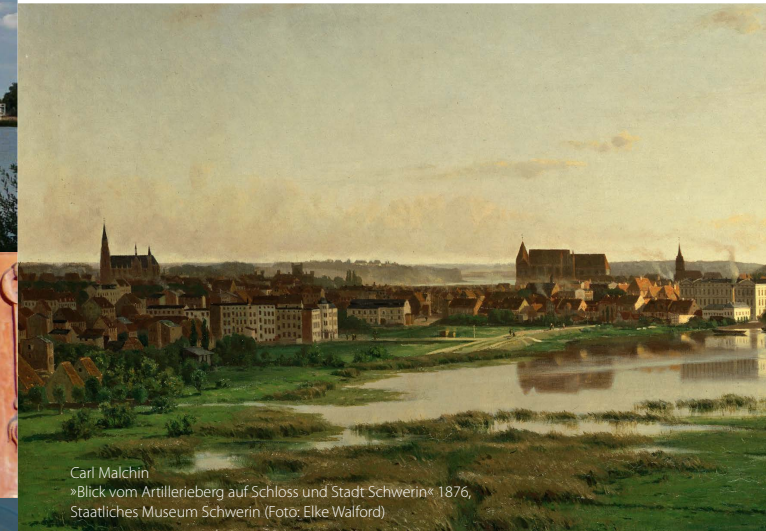
Carl Malchin »Blick vom Artillerieberg auf Schloss und Stadt Schwerin« 1876, Staatliches Museum Schwerin

Das Schweriner Residenzensemble repräsentiert in idealtypischer Weise einen Fürstensitz des 19. Jh. im Stile des romantischen Historismus. Zwischen 1825 und 1883 entstand es unter den Großherzögen Friedrich Franz I., Paul Friedrich und Friedrich Franz II. von Mecklenburg-Schwerin. Mit den Bauten für die Hof- und Staatsverwaltung wie dem Kollegiengebäude, dem Theater und dem Museum für die fürstlichen Kunstsammlungen am Alten Garten ist das Residenzensemble in den Stadtraum hinein erweitert. Zum Ensemble gehören ebenso Dom und Schelfkirche mit ihren herzoglichen Grablagen, die Paulskirche, der Kasernenkomplex zum Schutz der Residenz, das Neustädtische Palais und Funktionsbauten wie der Marstall oder die Hofwäscherei.